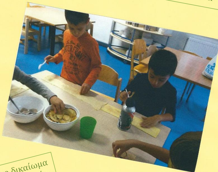
Ο καθένας είχε το δικαίωμα να δημιουργήσει το δικό του μηλοπιτάκι