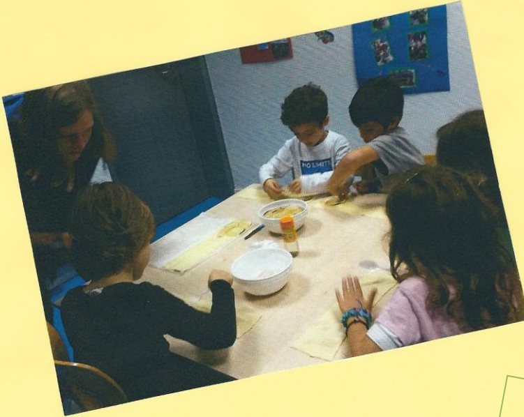
Jeder durfte sein eigenes „Apfelröschen“ herstellen